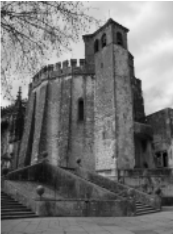
Convento de Cristo - Tomar - Pt

Antônio José Saraiva, O Crepúsculo da Idade Média em Portugal