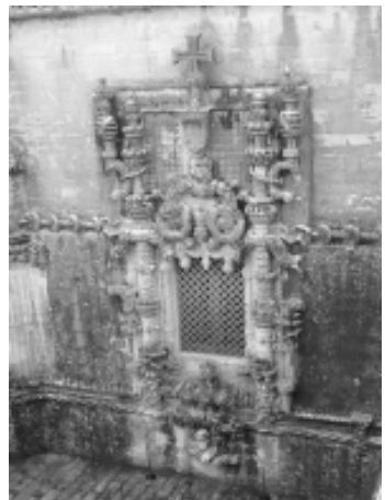
Oratório - Convento de Cristo - Tomar - Pt